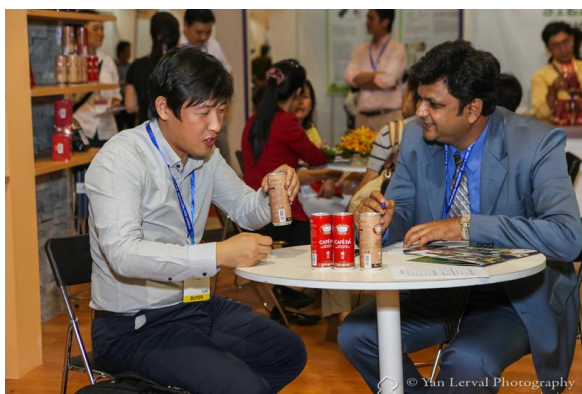
1:1 비즈미팅 현장